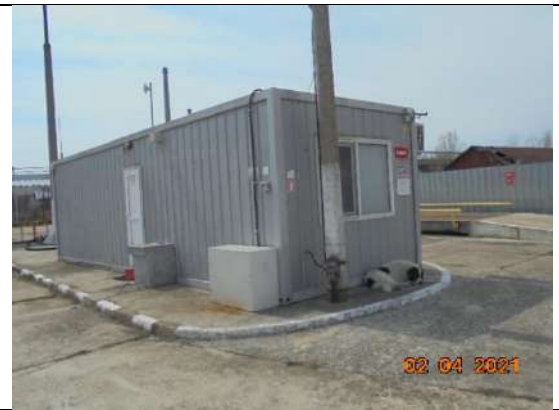
Фургон офис -300*900