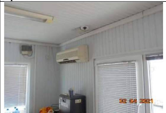
Климатик в офис