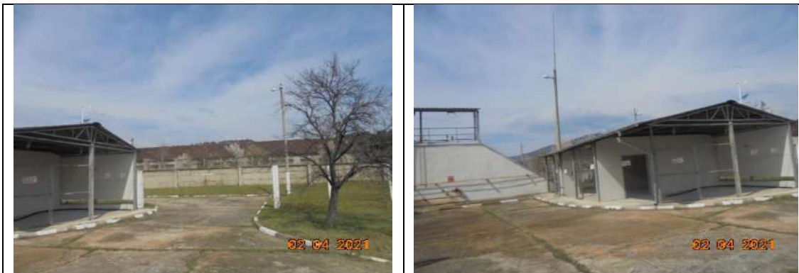
Пълначно-метален навес-ограден с мрежа