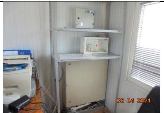
ИКУНК СИТЕМА 1162