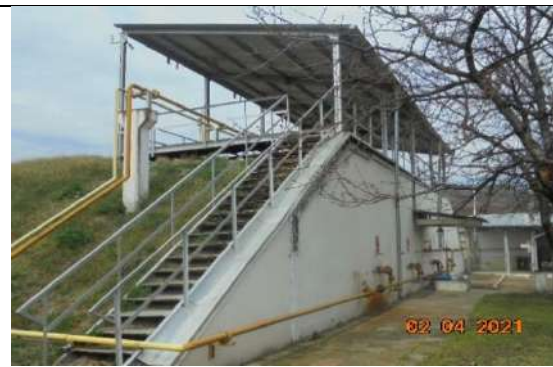
Попорна стена към резервоари