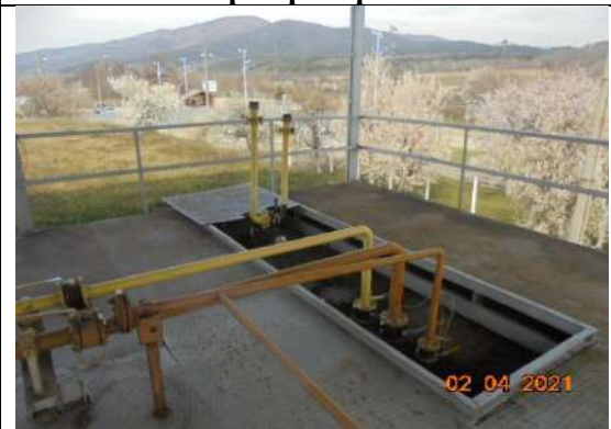
Тръбни разводки, арматура