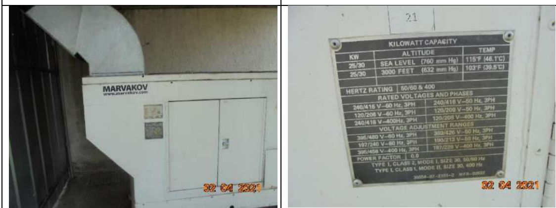
Дизелов агрегат сер. Номер ASK-30-2106, REG RZ32792