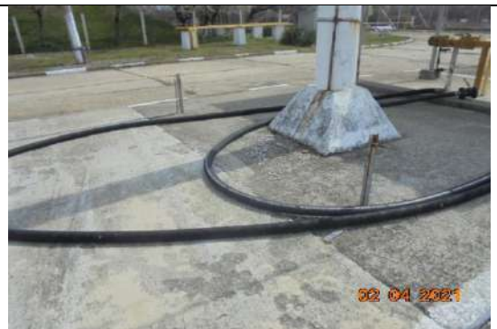
Маркучи за газ