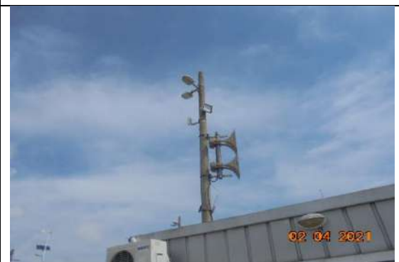
Опвестителна система Gibon