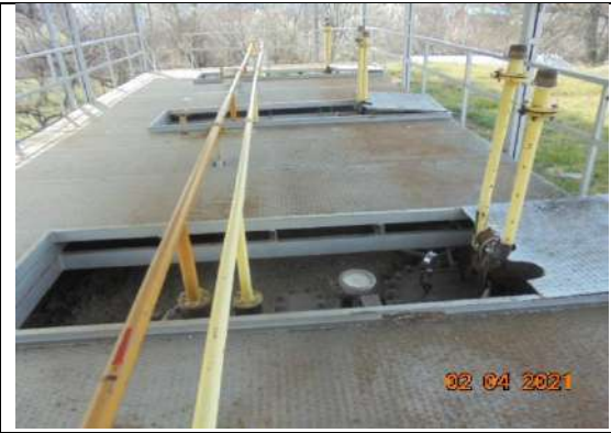
Метална конструкция върху 4 броя резервоари