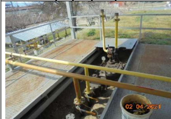
Клапани, кранове, възвратни вентили