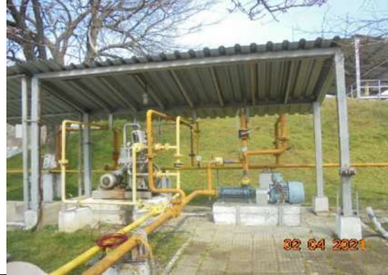
Навес -метална конструкция