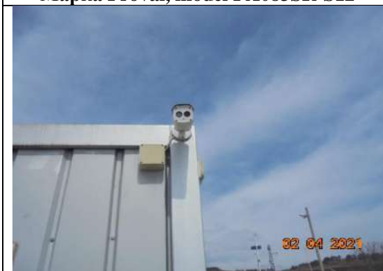
Видео наблюдение- камери оклоло 20 броя