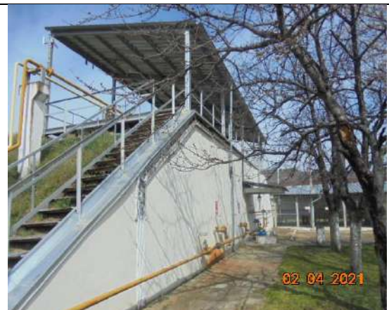
Кранове към резервоари