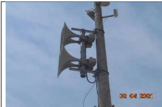
Оповестителна система-фунии – „Telegrafia“