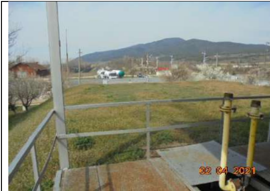
Насипи – резервоари 4 броя