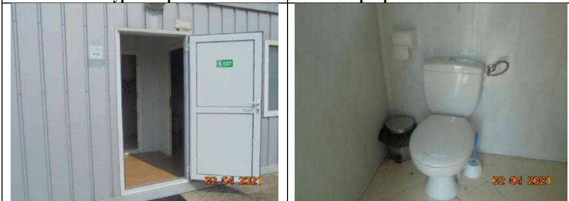
Офис със сан. възел