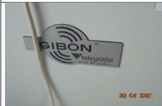
Табло опов. система