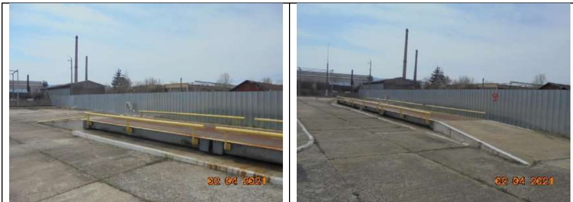
Автокантар-метална основа с дължина 20м с оградни тръби