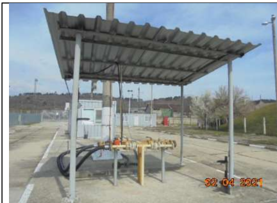
Автоналивно-навес с кранове