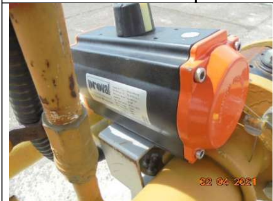
Марка Proval, model PA083SR-S12