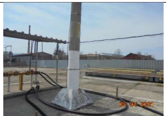
Мълниезащитна система-3 броя метални стълбове в земята със шини и бетонна стъпка