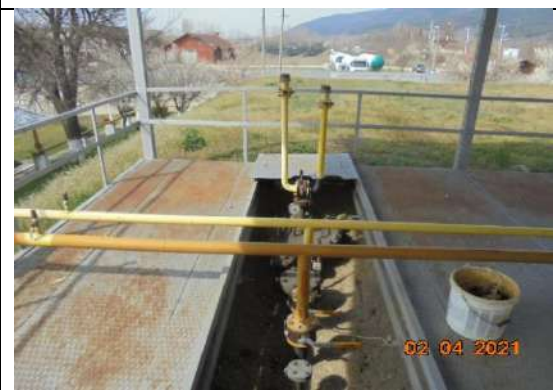
Подземни резервоари-тръби и кранове